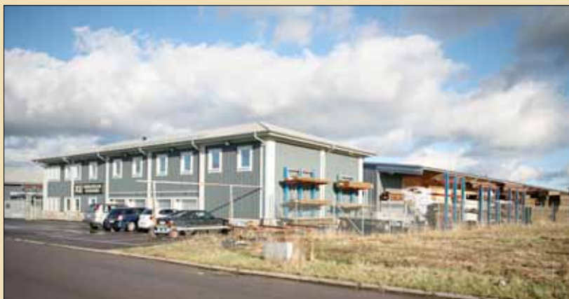
Vår anläggning i Fjärås med kontor, fabrik och lager.