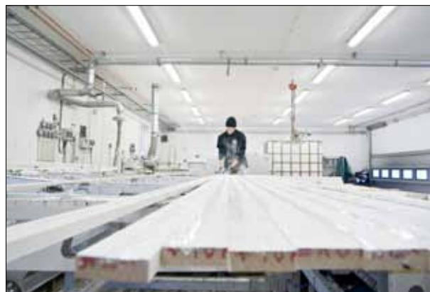
Färdigmålat från fabrik, praktiskt och kostnadseffektivt.

Spara tid och pengar och låt oss göra jobbet, före leverans.